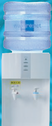
ウォーターネットサーバーS (卓上タイプ)