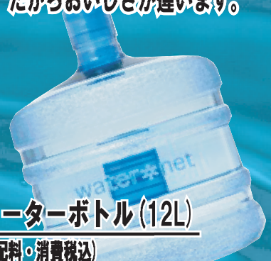
ミネラルウォーターボトル (12L)

・重たいペットボトルをご自宅まで運ぶ苦勞は もうおしまい！お電話一本でご自宅・オフィス まで迅速、丁寧にお届けいたします。